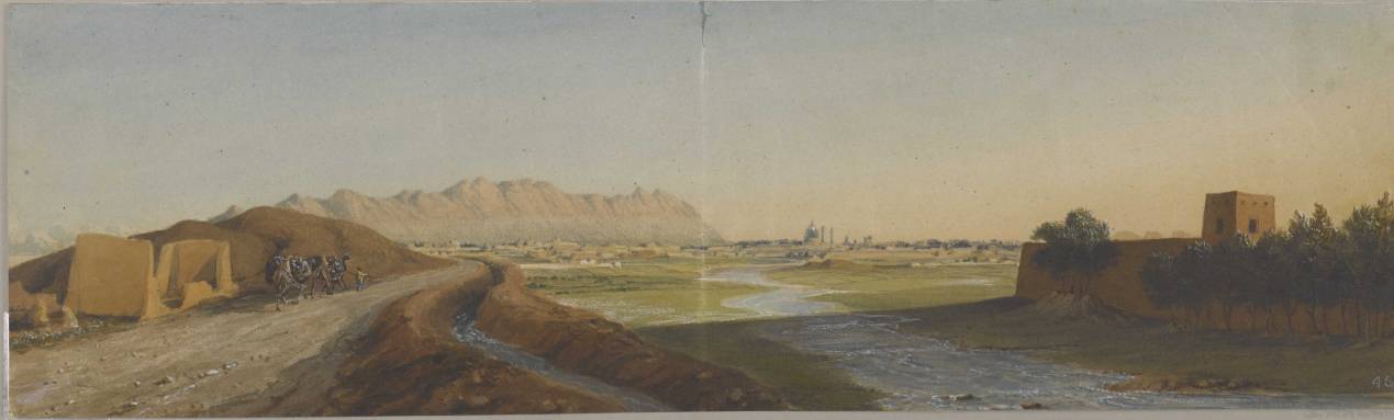
45A A view of either Isfahan or Shiraz, perhaps Teheran, ? most probably Isfahan.