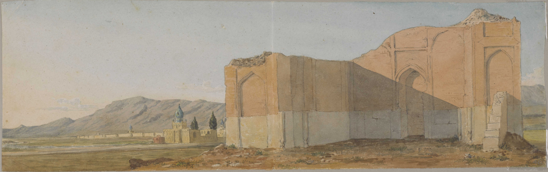
40. Shiraz, - Ruins of the Mosleh, Hafiz's favourite retreat near Shiraz.