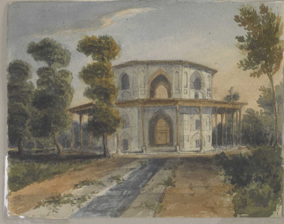
44. Shiraz - Probably the tomb of the last Sadi.