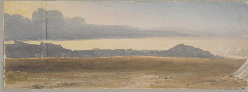
45. Shiraz - Probably a sketch of the Madra-i-Selmen showing the toll station at the foot of it - Evening.