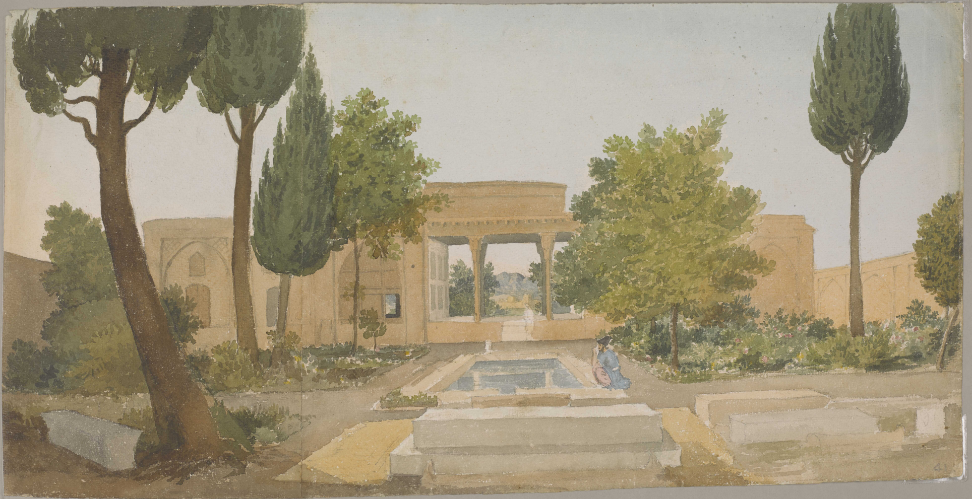
41. Shiraz, - Tomb of the poet Hafiz or the Hafizieh.

"المعسكر في دلكي على الطريق من بوشهر إلى شيراز" رسم جوزيف دارسي (١٧٨٠-١٨٤٦) [٢و] (٢/١)